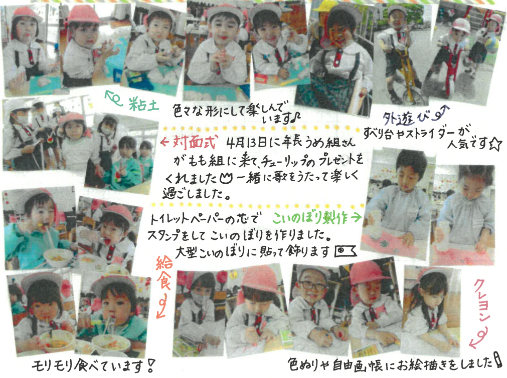
粘土 色々な形にして楽しんでいます。