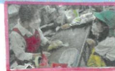
お買い物上手にできたよ!