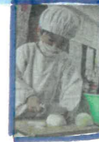
←頑張る野菜切ったよ!