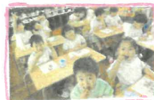
おかわりください!