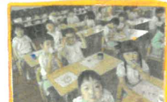
甘茶おめれおいしいね!