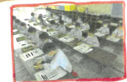
習字 はじめての習字の 筆で書くのが楽しい。 最後は、手が真っ黒い...

卒園アルバム個人写真撮影について 6月15日(水)に行きます。 服装はブラウス(半袖又は長袖)、名札、園指定 のサングラスとなります。