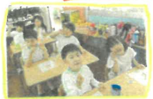
献茶をし、みほとけさまのお誕生をお祝いしました。甘茶に甘茶おめれみんなでおいしくいただきました!